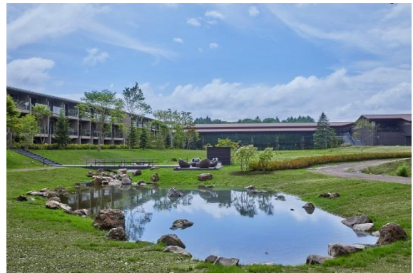
パブリック棟外観とグリーンフィールド