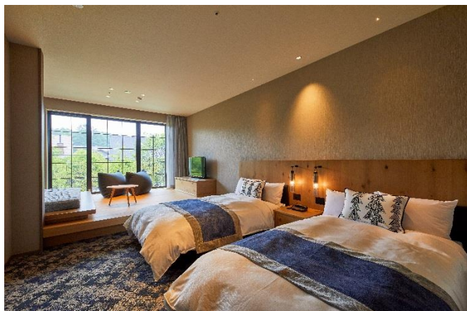
ハーヴェストクラブ客室

会員権募集においても総募集口数の8割以上の販売が終了し、当初の予想を大きく上回るペースで販売が進んでおります。