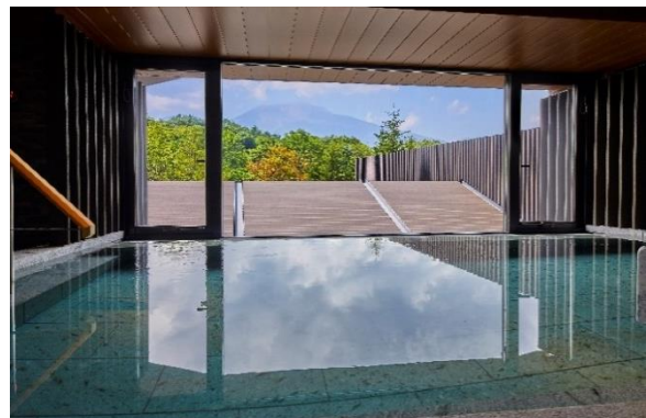
露天風呂付温泉大浴場