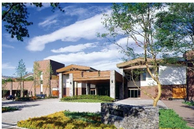
東急ハーヴェストクラブ旧軽井沢

2001年7月、伝統ある旧軽井沢の地に「東急ハーヴェストクラブ旧軽井沢」が誕生して以来、2007年には「東急ハーヴェストクラブ旧軽井沢アネックス」、2018年4月にはヒルトン日本初進出のブランドホテルである「KYUKARUIZAWA KIKYO, Curio Collection by Hilton」など、東急不動産のホテル事業は軽井沢の地で展開が進んでおります。今回誕生する「東急ハーヴェストクラブ軽井沢&VIALA」もそのひとつ。国内外にある有数のリゾート地で多様な施設を展開してきたノウハウを生かし、軽井沢の地域特性を踏まえた更なる魅力付けに取り組んでおります。