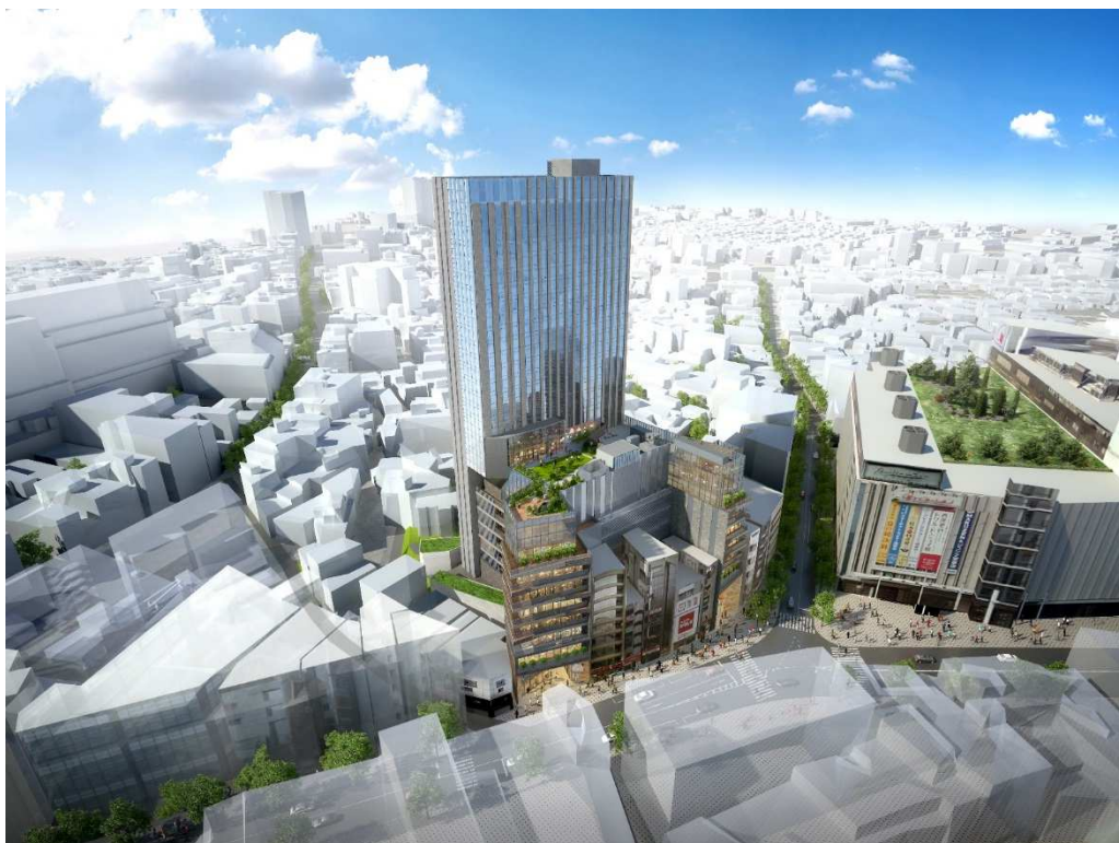
[建物イメージ（※計画中のため形状等が変更となる場合があります）]

近年、渋谷駅周辺では大型の開発が進み、今後も複数の新たなタワーの完成が予定されているなど、渋谷駅周辺は大きな転換期を迎えようとしています。一方で、渋谷全体の活性化や回遊性の向上という観点から、駅周辺だけではなく周縁部の開発も重要な役割を果たします。地上 28 階、地下 1 階、高さ 120m、敷地面積 5,737 m 2 、延べ床面積 40,950 m 2 の大型開発となるこの度の「(仮称) 渋谷区道玄坂二丁目開発計画」においても、渋谷全体の発展の一端を担うことなどを目標に開発を予定しています。