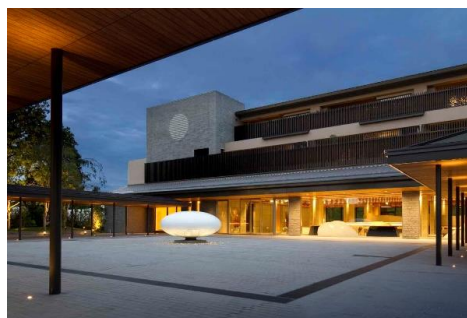
東急ハーヴェストクラブ京都鷹峯&VIALA