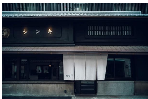
nol kyoto sanjo