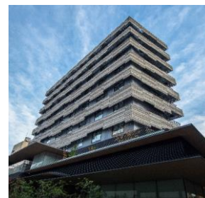
東急ステイ京都新京極通