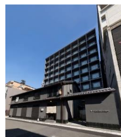
東急ステイ京都両替町通

東急不動産ホールディングスグループでは、本施設以外にも隣接する「東急ハーヴェストクラブ京都鷹峯&VIALA」をはじめ、昨年開業した「nol kyoto sanjo」（2020年11月）や、「東急ステイ京都両替町通」（2017年11月開業）、「東急ステイ京都新京極通」（2018年12月開業）がございます。様々な需要を捉え、今後もお客様に満足いただける施設を提供してまいります。