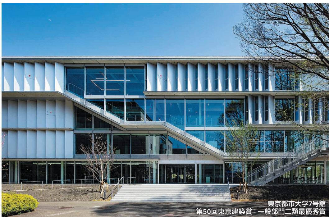
東京都市大学7号館 第50回東京建築賞：一般部門二類最優秀賞

事業性を念頭に置きなが らお客様のイメージに合 う細部まで一貫性のある デザインを追求します。