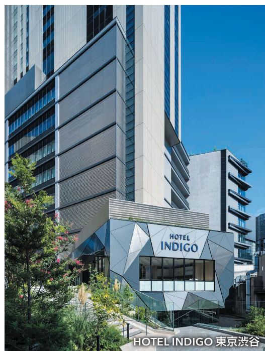
HOTEL INDIGO 東京渋谷