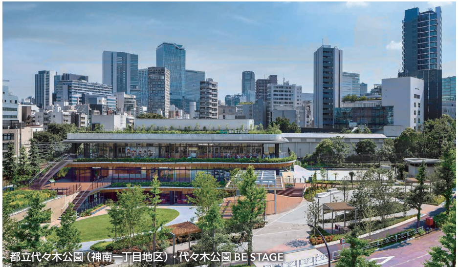
都立代々木公園（神南一丁目地区）・代々木公園 BE STAGE