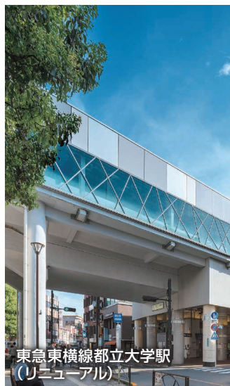
東急東横線都立大学駅 (リニューアル)