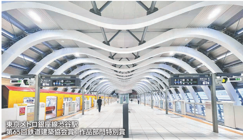
東京メトロ銀座線渋谷駅 第65回鉄道建築協会賞：作品部門特別賞