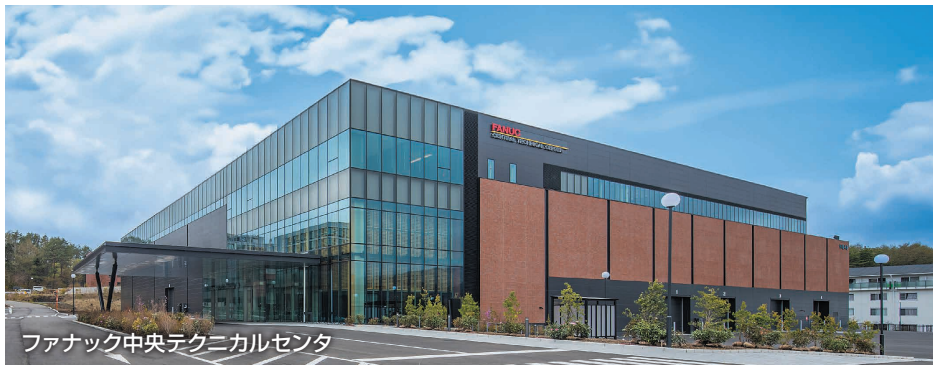
ファナック中央テクニカルセンタ