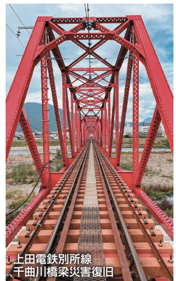
上田電鉄別所線 千曲川橋梁災害復旧