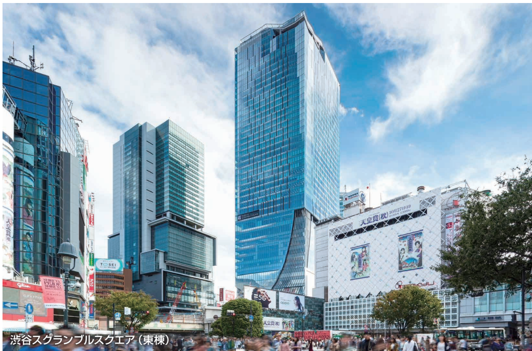
渋谷スクランブルスクエア（東棟）