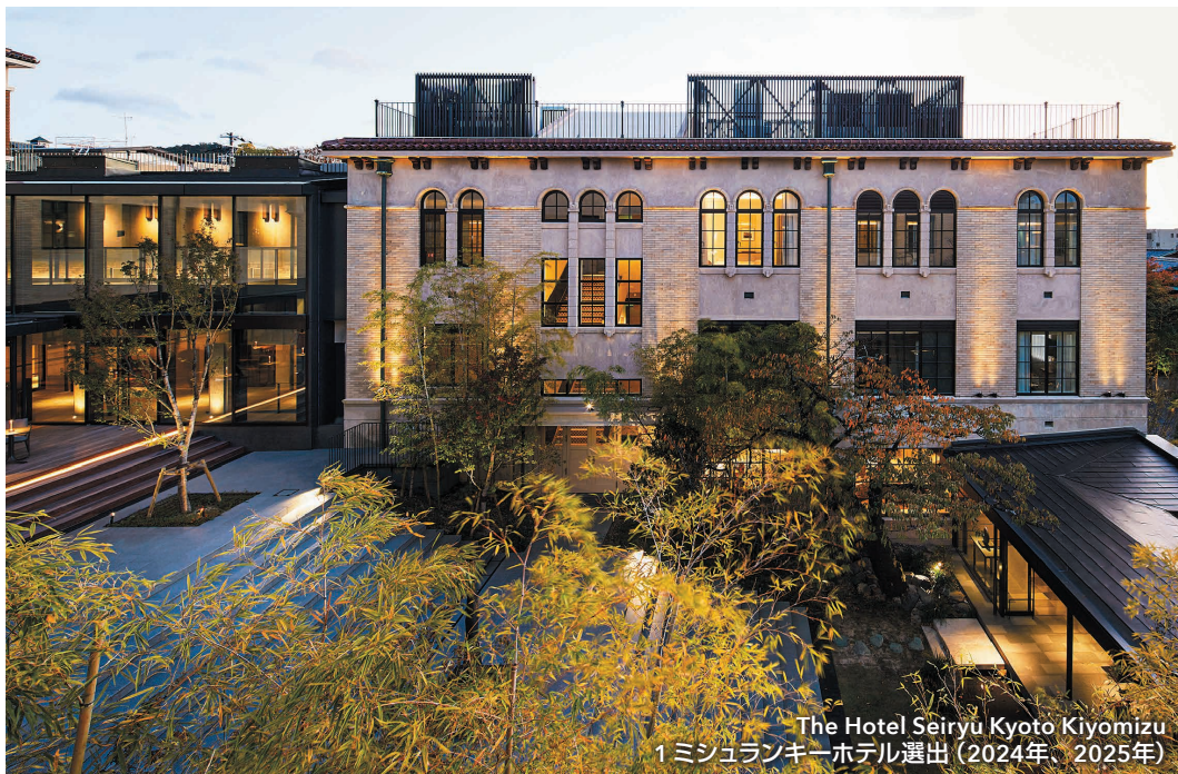
The Hotel Seiryu Kyoto Kiyomizu 1 ミシュランキーホテル選出 (2024年、2025年)

既存の建築物を評価し 歴史的価値の尊重と時代 に合わせた再生をご提案 いたします。