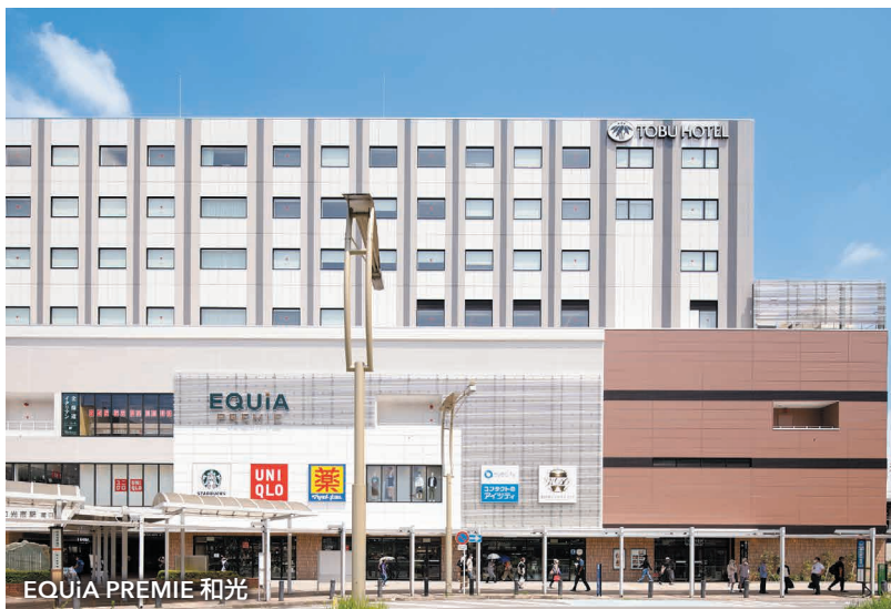
EQUiA PREMIE 和光