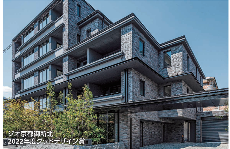
ジオ京都御所北 2022年度グッドデザイン賞