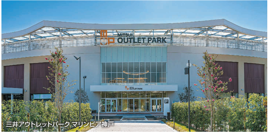
三井アウトレットパーク マリンピア神戸