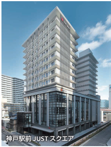
神戸駅前 JUST スクエア