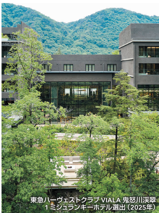
東急ハーヴェストクラブ VIALA 鬼怒川溪壑 1 ミシュランキーホテル選出 (2025年)

シティ型、リゾート型を 問わず、敷地の基盤設計 ～建築設計までトータル で事業に携わります。