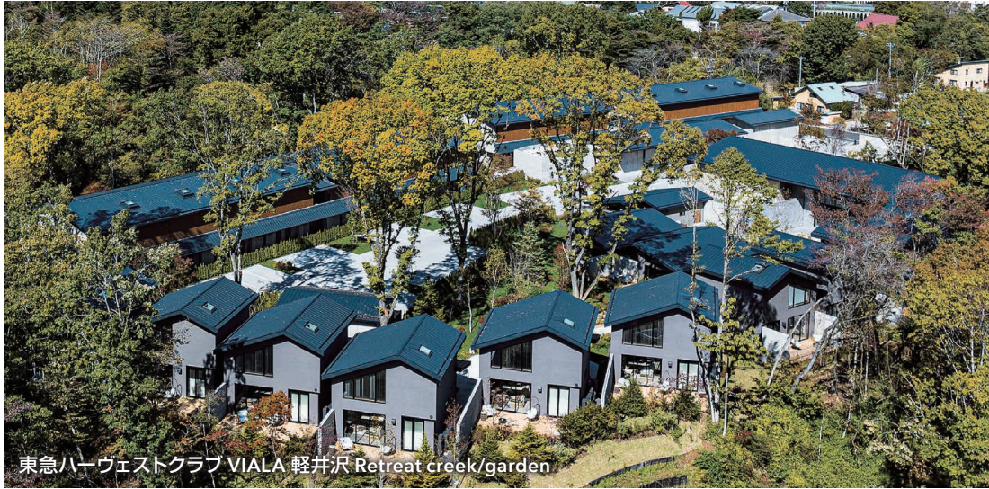
東急ハーヴェストクラブ VIALA 軽井沢 Retreat creek/garden