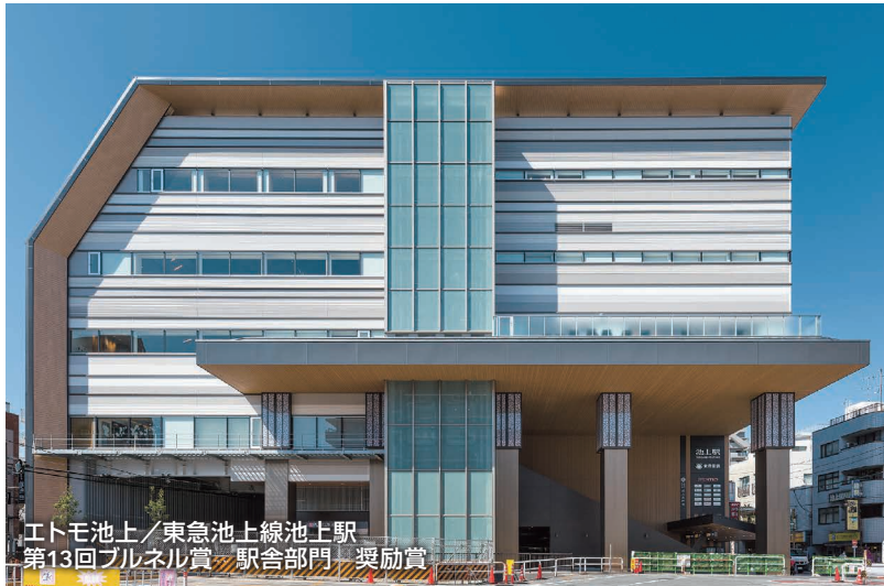
エトモ池上/東急池上線池上駅 第13回ブルネル賞 駅舎部門 奨励賞