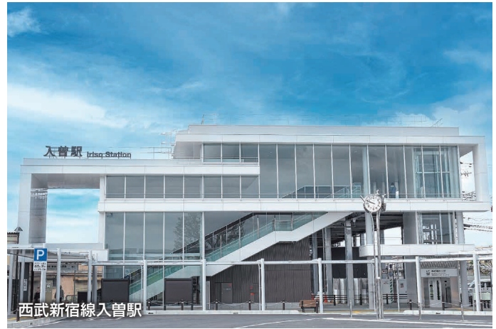
西武新宿線入曽駅