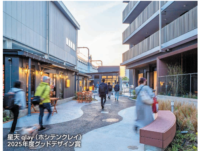
星天 qlay (ホシデンクレイ) 2025年度グッドデザイン賞