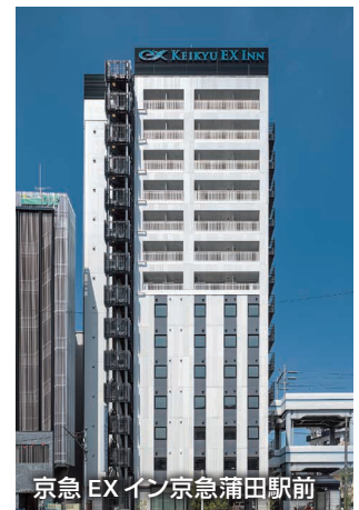
京急 EX イン 京急蒲田駅前