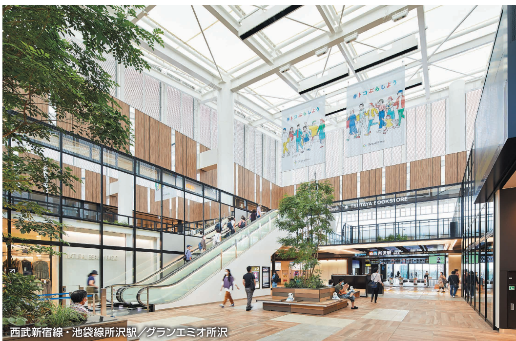
西武新宿線・池袋線所沢駅／グランエミオ所沢

沿線に住む人、訪れる人、 働く人が利用する駅周辺 開発を、街の未来につな がる資産として創ります。