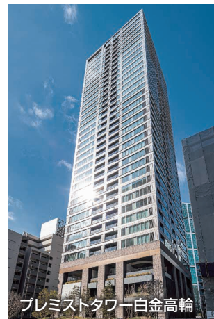
プレミストタワー白金高輪