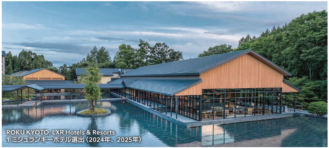
ROKU KYOTO, LXR Hotels & Resorts 1 ミシュランキーホテル選出 (2024年、2025年)