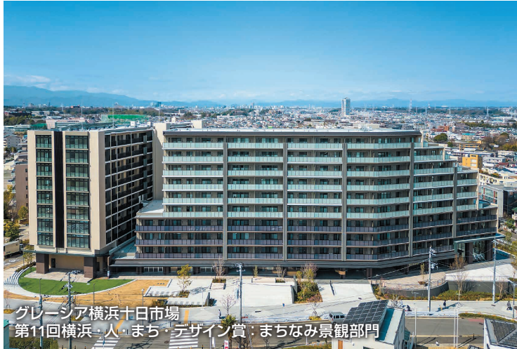
グレースシア横浜十日市場 第11回横浜・人・まち・デザイン賞: まちなみ景観部門