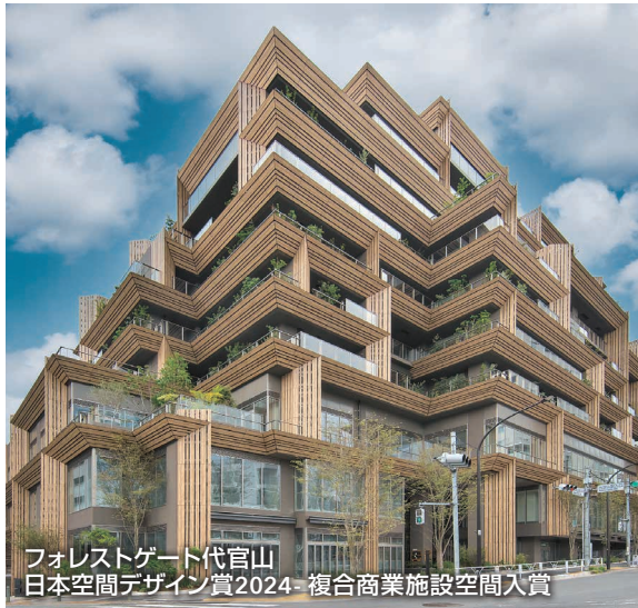
フォレストゲート代官山 日本空間デザイン賞2024- 複合商業施設空間入賞